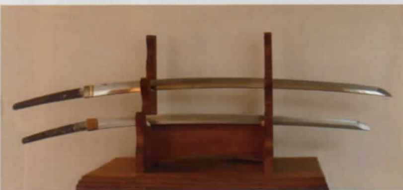
▲ 昭和17年 伊曾乃神社御昇格記念 奉納刀 上《刀 銘 平貞重國作》/ 下《刀 銘 皇紀二千六百二年三月吉日 源義宗造》 伊曾乃神社蔵