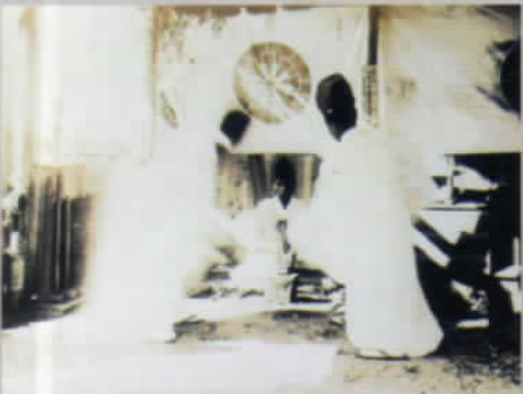
▲ 昭和16年9月19日 皇紀二千六百年記念 伊曾乃神社奉納太刀鍛造