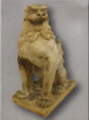
▲ 《狛犬阿形石膏原型》昭和35年 伊藤五百亀作 五百亀記念館蔵